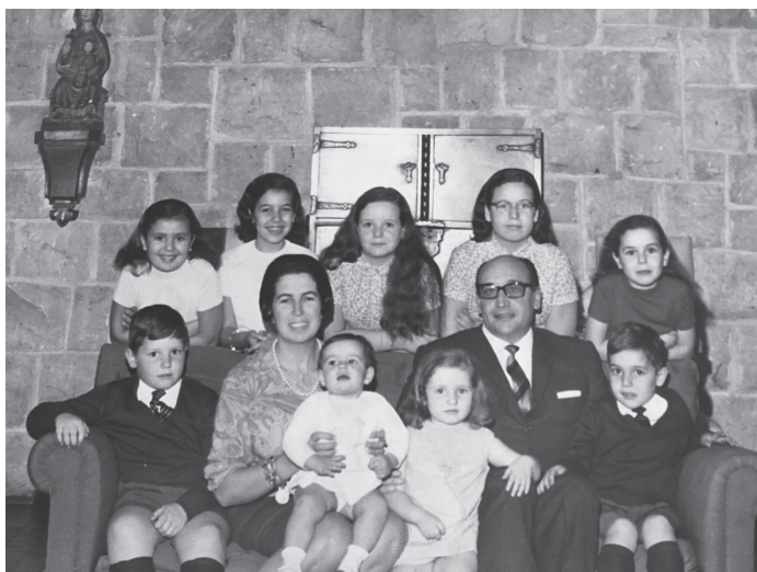
Una foto de la familia Hernández-Sampelayo al completo.