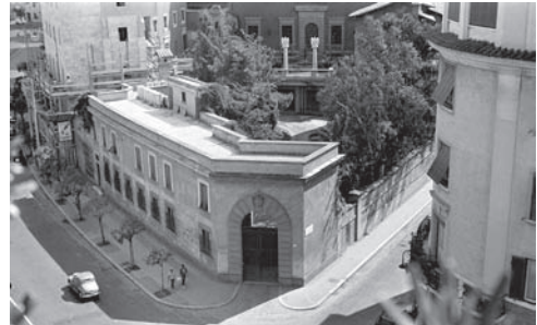
El Pensionato en los años cincuenta.