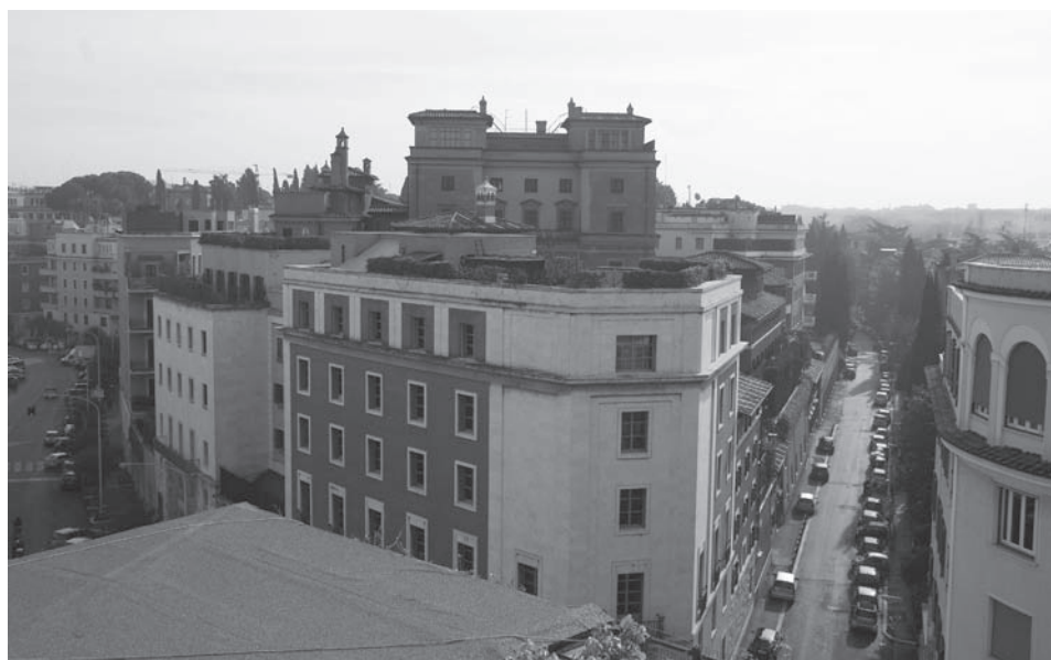
Villa Tevere en la actualidad, desde el lado norte. En primer plano, Uffici. Por detrás asoma la Villa Vecchia.