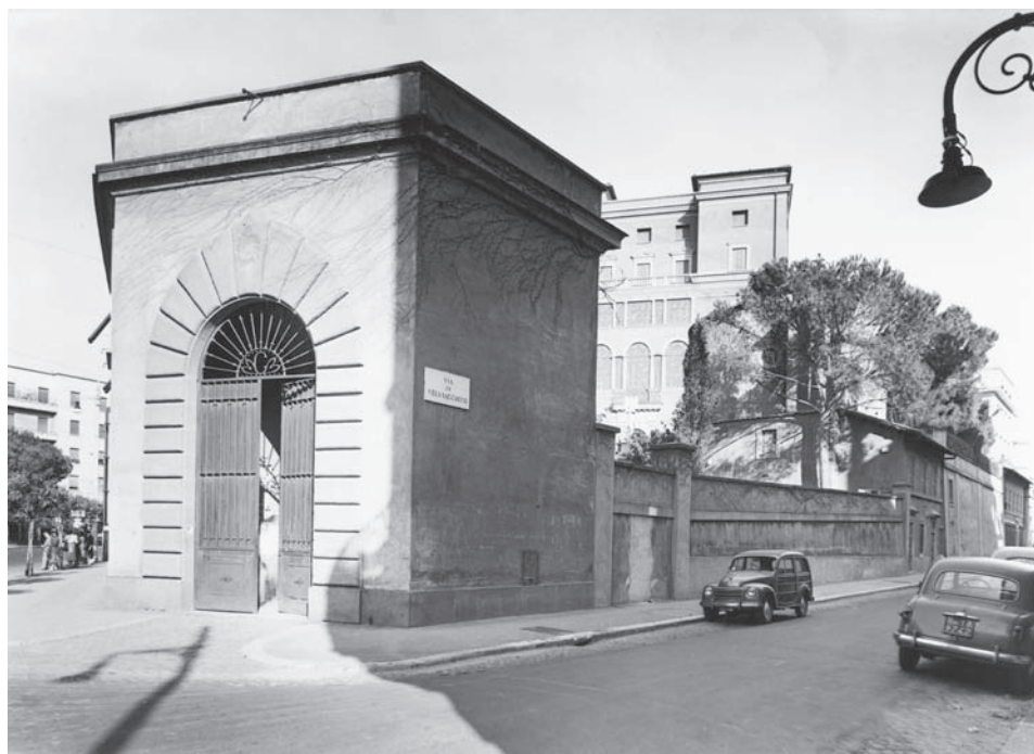
Villa Tevere a mediados de los años cincuenta desde la esquina Bruno Buozzi – Villa Sacchetti.