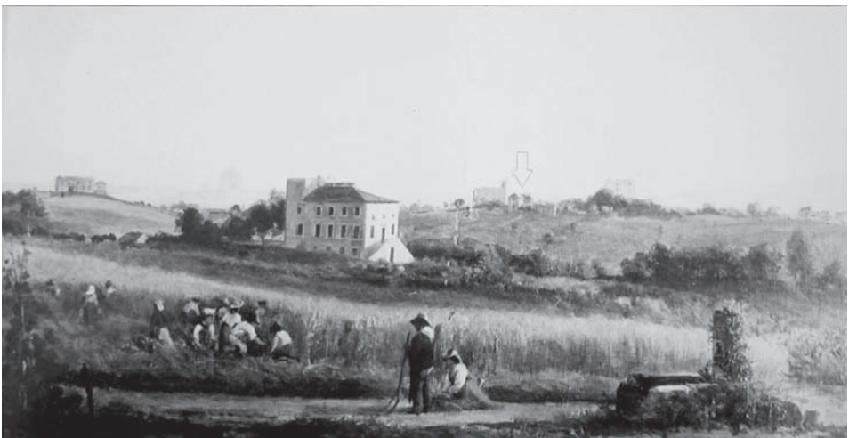
Giacomo Maes: La Vigna Sacchetti (1878). También aquí se señala con una flecha el lugar donde se encuentra Villa Tevere. Si en el grabado de Falda la perspectiva era sur-norte, aquí es sureste-noroeste. En la margen izquierda del cuadro, la Vigna Cartoni, junto a la actual Via De Notaris. Entre el casino de la Vigna Cartoni y el de la Vigna Sacchetti (el edificio principal en el centro del cuadro), Maes ha representado en lontananza, apenas visible, la cúpula de San Pedro. A la derecha, sobre una colina, la Vigna Balestra, y al fondo, también difícilmente reconocible, el Monte Mario.