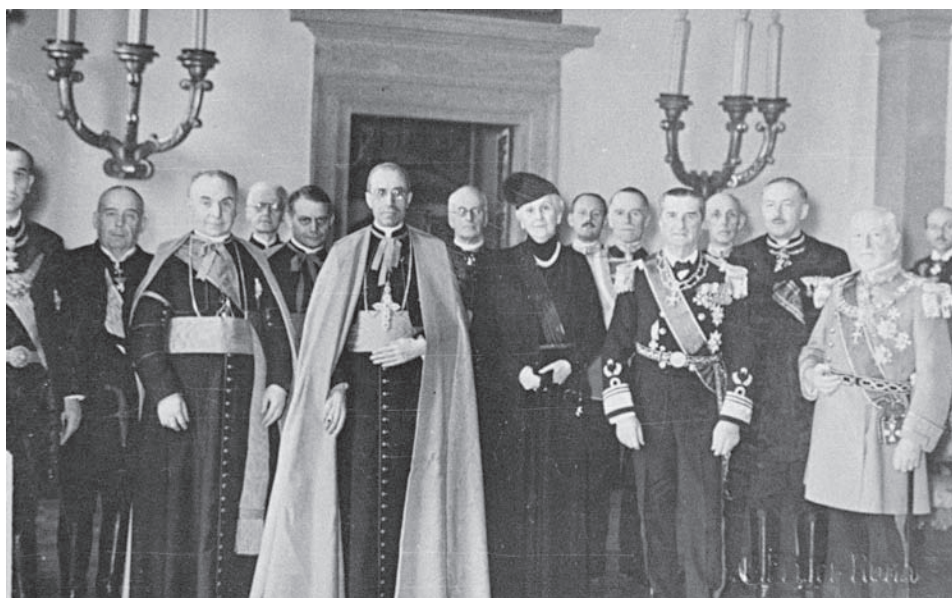
Villa Mazzoleni en 1936. El cardenal Pacelli y el almirante Horthy en la Legación de Hungría ante la Santa Sede.